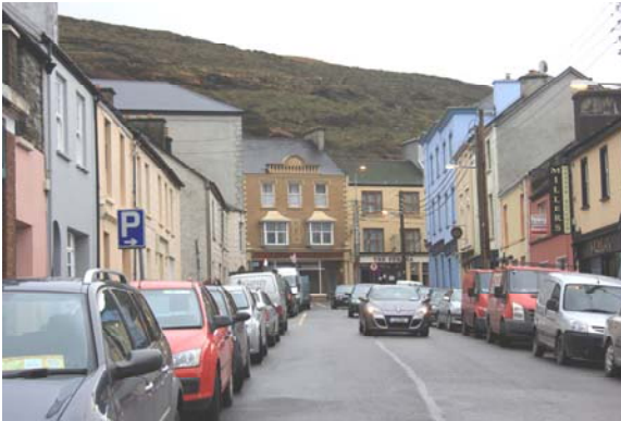
Grianghraf 25: An radharc ar Shráid Uí Chonaill i dtreo An Phríomhshráid

Tá roinnt radharcanna laistigh den CCA, go háirithe ag féachaint ó dheas ar Shráid Uí Chonaill i dtreo An Phríomhshráid leis An Tig Gaelach mar phointe fócasach. (Grianghraf 25) Mar an gcéanna, ag féachaint siar ar an bPríomhshráid le spuaic iarEaglais na hÉireann sa chúlra. Cuirtear leis an radharc seo le caoile na sráide. (Grianghraf 26)