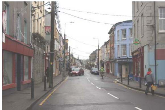
Grianghraf 26: An radharc ar an bPríomhshráid le spuaic iarEaglais na hÉireann sa chúlra