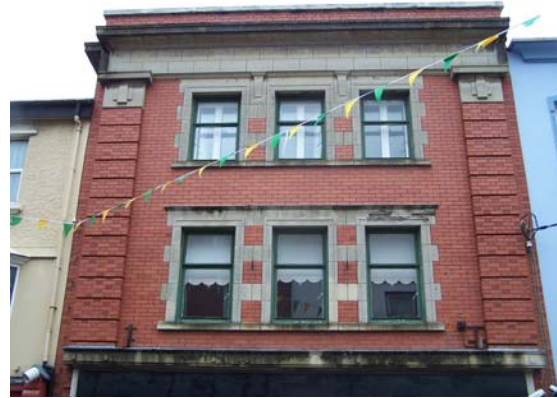
Grianghraf 8 An Phríomhshráid