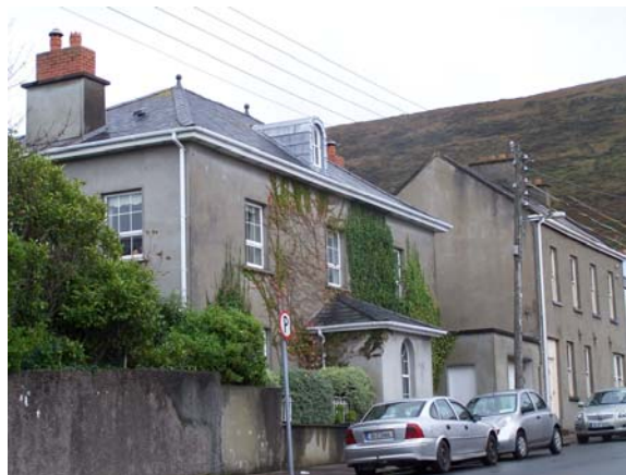
Grianghraf 24 Teorainn balla cloich

Tá aghaidh fhormhór na struchtúr sa CCA ar an gcosán seachas cúpla foirgneamh ar Shráid an Droichid agus Teach na Cúirte ar Shráid Nua an Mhargaidh.