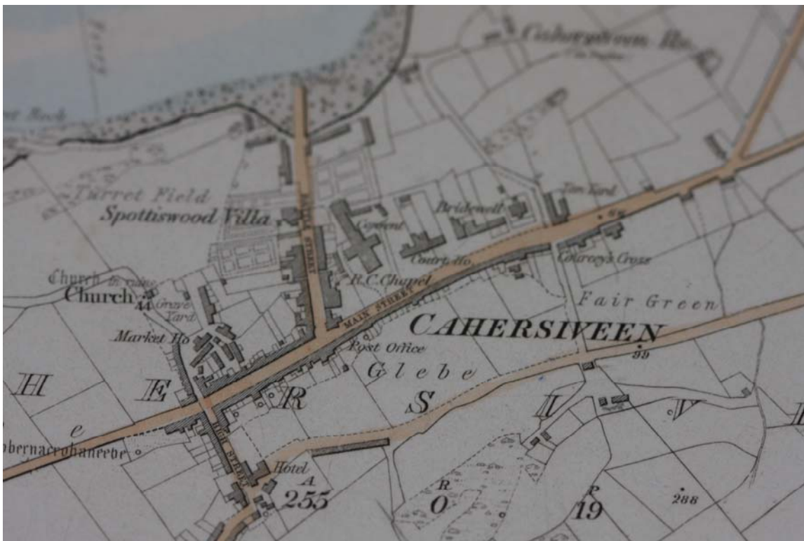
Mapa 2: 1ú Eagrán den Mhapa SO 1842