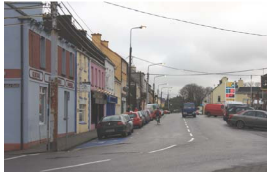
Grianghraf 2: Sráid Nua an Mhargaidh., Sa