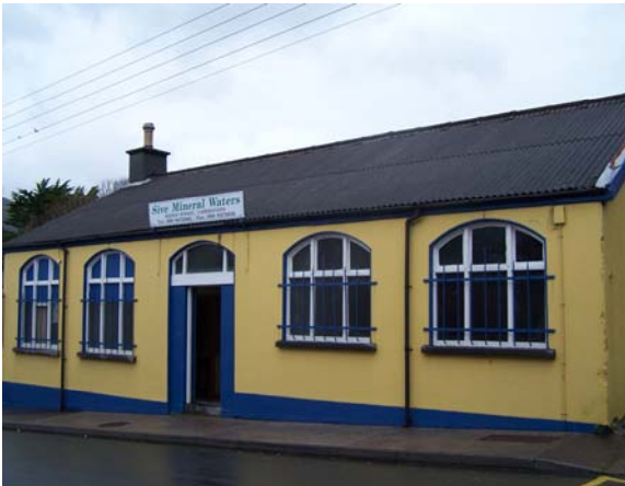
Fig 18 Sráid an Droichid

Tá úsáid dathanna le béim a chur ar ghnéithe den ailtreacht léirithe go héifeachtach i roinnt cásanna (Grianghraf 18 & 19)