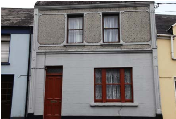
Grianghraf 16: Seansráid an Mhargaidh

Tá éagsúlacht mór in airde na mullach ar fud an CCA. Díonta sclátaithe claonta atá i bhformhór mór na ndíonta ach tá eisceachtaí ann (Grianghraf 14) a chuireann le spéis an sráid-dreacha. Feidhmíonn athruithe ar na mullaí le feabhas a chur ar an sráid-dreach. (Grianghraf 15)