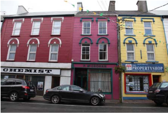
Grianghraf 6 An taobh thuaidh den Phríomhshráid