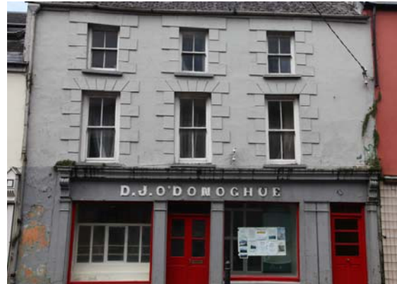
Grianghraf 10 An tSráid Mhór Thiar

Tá roinnt cuarfhoirgneamh cúinne laistigh den CCA a chuireann go mór le saintréithe na sráid-dreacha, tá foirgneamh cuíosach nua an Chomhair Chreidmheasa tar éis an téama seo a ghlacadh freisin. (Grianghraf 11-13)