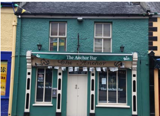
Grianghraf 7 An Phríomhshráid

d) Ábhar Tógtha-Cur Síos Ginearálta Léiríonn an mionsonrú ar an bPríomhshráid saintréithe agus éagsúlacht na bhfoirgneamh a fhaightear go comónta i mórán bailte in Éirinn. Tá meascán spéisiúil stíleanna tithíochta i gCathair Saidhbhín a thugann beogacht don sráid-dreach. Ar an taobh theas den Phríomhshráid tá sraith foirgneamh trí urlár atá mórán mar a chéile le ballaí plástaráilte rialaithe agus línithe le múnlaíl mhaiseach stuach os cionn na bhfuinneog ar an gcéad urlár agus múnlaíl chothrom os cionn na bhfuinneog ar an dara urlár. I gcodarsnacht leo seo níl dearadh na bhfoirgneamh ar an taobh theas de réir a chéile ach tá siad fós inspéise ó thaobh na hailtireachta de. Tá aghaidh thraidisiúnta na siopaí i gcodarsnacht leis an stíl chlaisiceach níos foirmeálta. (Grianghraf 7 & 8)