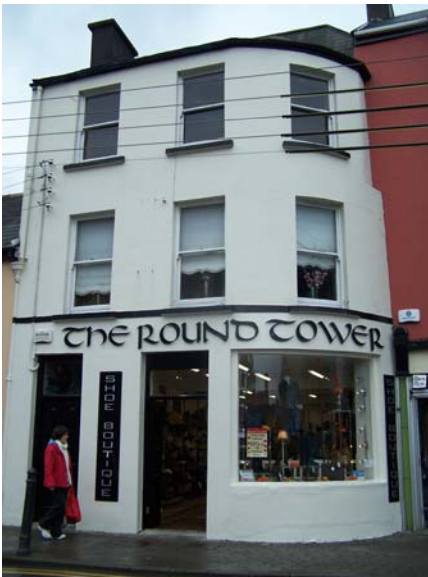
Grianghraf 11 Sráid na hEaglaise

Tá roinnt cuarfhoirgneamh cúinne laistigh den CCA a chuireann go mór le saintréithe na sráid-dreacha, tá foirgneamh cuíosach nua an Chomhair Chreidmheasa tar éis an téama seo a ghlacadh freisin. (Grianghraf 11-13)