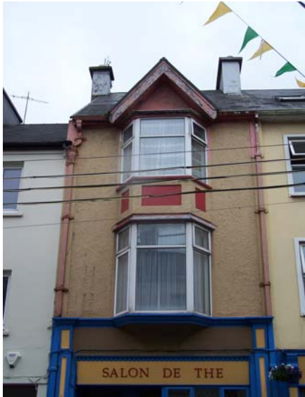
Grianghraf 20 Seansráid an Mhargaidh