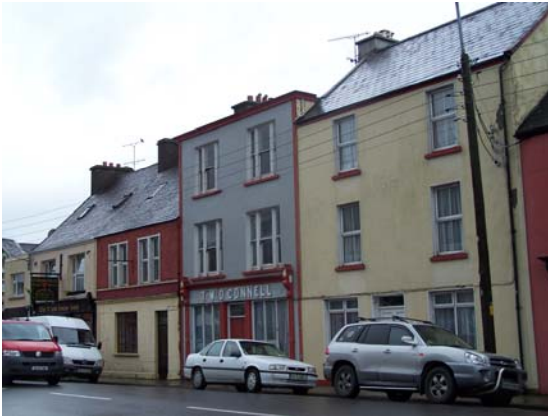
Grianghraf 14 Sráid an Mhargaidh Nua