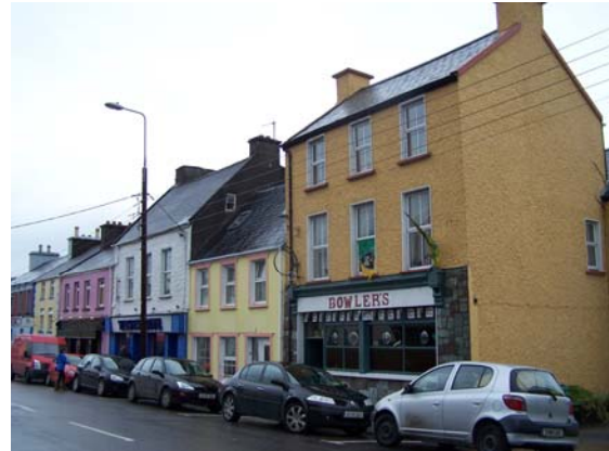
Grianghraf 15 Sráid an Mhargaidh