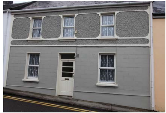
Grianghraf 17 Seansráid an Mhargaidh