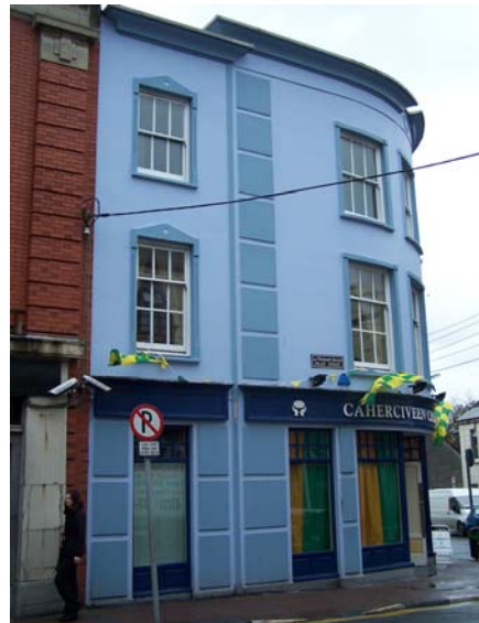
Grianghraf 12 An Phríomhshráid