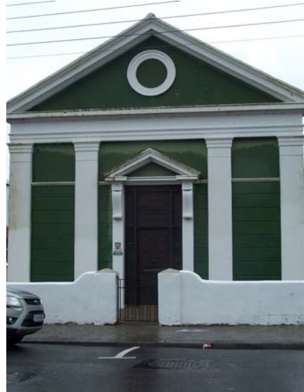
Grianghraf 19 Teach na Cúirte