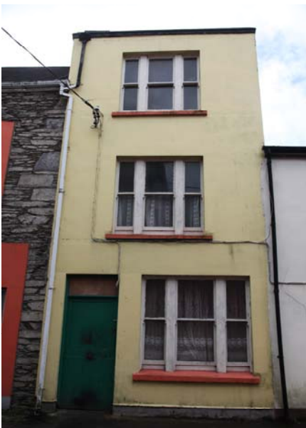
ul Area Plan

Tá athrú déanta ar roinnt slite isteach agus oscailtí thar na blianta le hoiriúint do chúinsí ar leith tráchtála nó tí, ach trí chéile, tá na fuinneoga, na doirse agus na bealaí áirseacha fanta cuíosach slán. Tá roinnt fuinneog oiriail ar airde dúbailte i gCathair Saidhbhí, rud a chuireann go mór leis an sráid-dreach, go háirithe i sráid chúng. (Grianghraf 21 & 22) Cuireann struchtúr trí urlár aonbhá le fuinneoga de stíl wyatt ar Sheansráid an Mhargaidh drámaíocht leis an sráid-dreach. (Grianghraf 20)