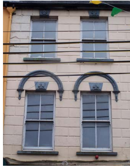
Grianghraf 21 An Phríomhshráid