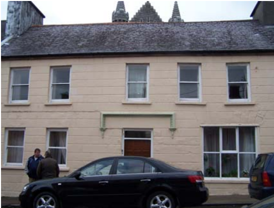
Grianghraf 9 Sráid Uí Chonaill

Déanann dearadh neamhshiméadrach chuid de na foirgnimh laistigh den CCA an tsúil a mhealladh agus cabhraíonn siad le beogacht a chur sa tsráid-dreach, faoi mar atá le feiceáil sna samplaí thíos. (Grianghraf 9 & 10)