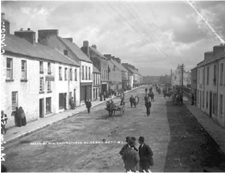
Grianghraf 1 Sráid Nua an Mhargaidh., 1880-1900 lá atá inniu ann