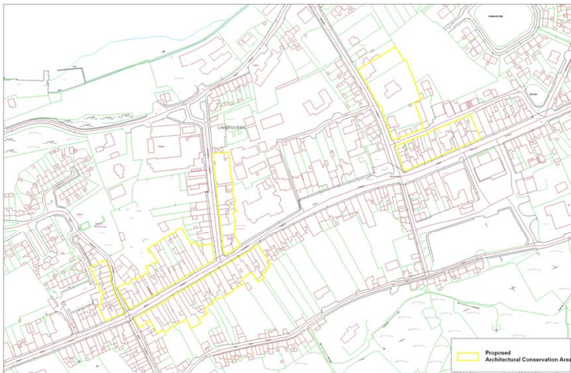
Mapa 1: Teorainn CCA

Tá an CCA atá beartaithe dírithe ar an bPríomhshráid, ag síneadh soir ón acomhal leis An tSráid Ard ar an taobh ó dheas chomh fada leis an gCloigtheach, Sráid na hEaglaise, agus ó chomharsanacht an acomhail le Sráid an tSeanmhargaidh ar an taobh ó thuaidh chomh fada le comharsanacht an acomhail le Sráid Uí Chonaill. Áirítear sa CCA freisin bloc de thimpeall dhá mhaoín déag ar an taobh thiar de Sheansráid an Mhargaidh, agus grúpa foirgneamh ar an taobh thoir de Shráid Uí Chonaill ag síneadh ó thuaidh ón acomhal leis an bPríomhshráid chomh fada leis an O'Connell Hotel. Faoi dheireadh, áirítear sa CCA bloc maoine ag síneadh soir ar Shráid Nua an Mhargaidh, ón acomhal le Sráid an Droichid agus ó thuaidh ar Shráid an Droichid ón acomhal le Sráid Nua an Mhargaidh.