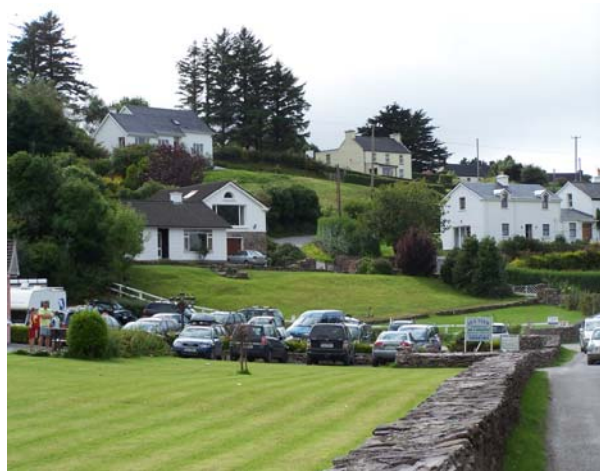
Fig 2: Foirm Tógtha

Rinne an lonnaíocht forbairt ar dtús timpeall ar choimpléacs an gharda cósta agus is gráig de thithe scaipthe atá ann gan aon chroílár sainithe ná sráid-dreach. Go bunúsach tá gnéithe aiceanta na háite tar éis foirm na lonnaíochta a shocrú.