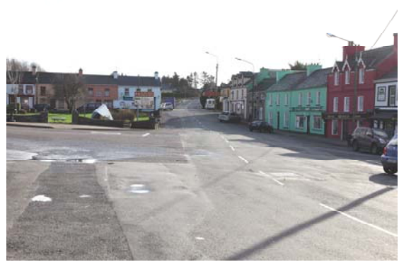
Grianghraf 8; Mar atá Inniu