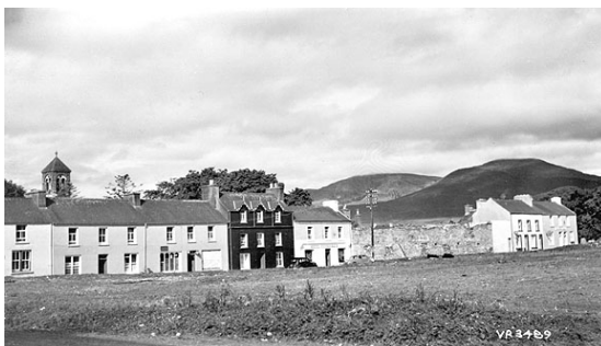
Grianghraf 9; 1880-1914