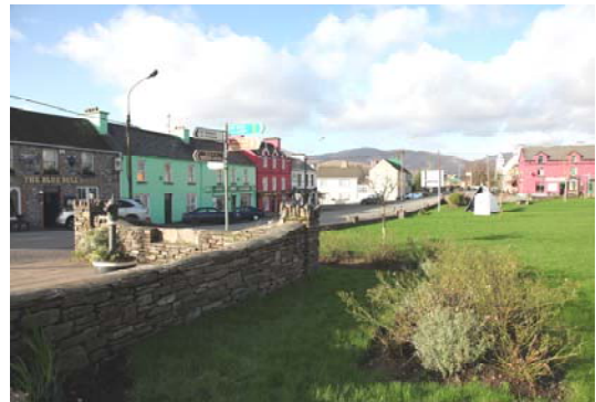
Grianghraf 2; Mar atá Inniu