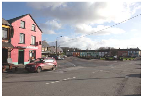
Grianghraf 6; Mar atá Inniu