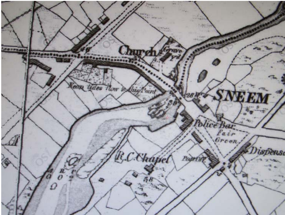
Léarscáil 2: Léarscáil OS Céad Eagrán 1842