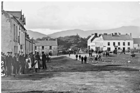
Grianghraf 3; 1880-1914