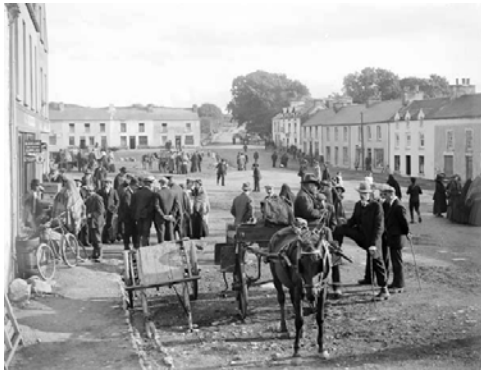
Grianghraf 7; 1880-1914