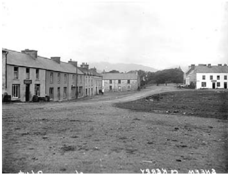
Grianghraf 1; 1880-1900

déanta ar an dtaobh theas den Chearnóg Theas agus tugtar ‘Faiche Aonaigh’ ar an dá chearnóg Thuaidh is Theas. Ní luaitear an dá Chearnóg Thuaidh ná Theas. Tugtar Ardán Bridgeview ar an dtaobh thoir theas den bhFaiche Aonaigh ó dheas.