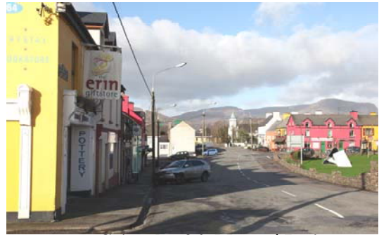
Grianghraf 4; Mar atá Inniu