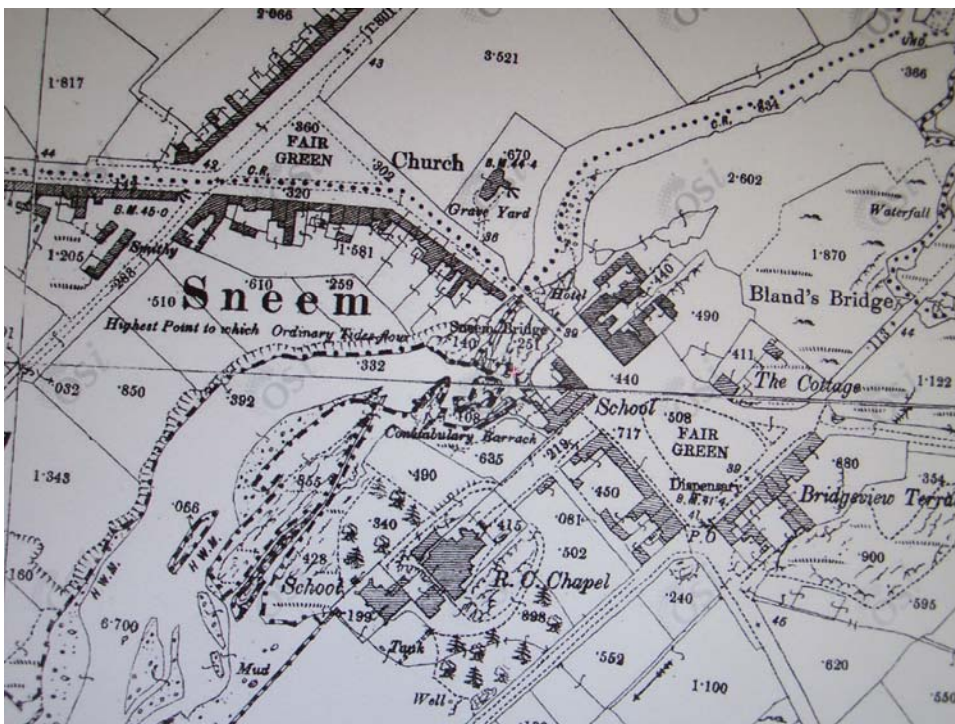
Léarscáil 3: Léarscáil OS Dara Eagrán 1897

Níor críochnaíodh an fhorbairt feadh an dá thaobh thoir theas agus thiar theas den Chearnóg Theas.