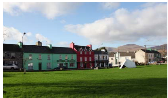
Grianghraf 10; Mar atá Inniu

Ach cuid de ghrianghrafanna luatha den Chearnóg Theas a chur i gcomparáid leo siúd a tógadh le deanaí is léir gur bheag athrú a tháinig ar an struchtúr uirbeach le breis is céad bliain.