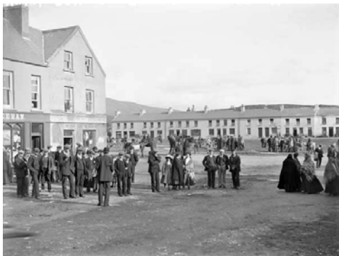
Grianghraf 5; 1880-1914