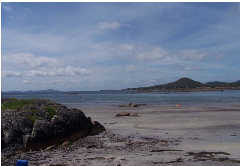
Fíor 3: Trá an Chuain

Tá roinnt gnéithe bradaigh go fluirseach sa tsráidbhaile is orthusan go príomha tá an Ghlúineach Bhiorach. Toisc nach plandaí dúchasacha iad siúd cuireann siad isteach ar an mbithéagsúlacht. Ní bhíonn aon chuma nádúrtha orthu is iad ag leathnú go tiubh ar thaobh an bhóthair, ar thalamh gan saothrú is ar uiscebhealaigh. Scaipeann siad go tapaidh ná níl sé éasca iad a mharú agus iad bunaithe. Tá sé rithábhachtach dá bhrí sin gan ithir mar a mbíonn riosóim ón nGlúineach Bhiorach, scoithigh tar éis fál a ghearradh nó slisíní eile a bhogadh ó áit go háit. Toisc na plandaí úd a bheith ag fás go tiubh sa lonnaíocht caithfidh aon mholadh forbraíochta, más cuí, scéim oiriúnach chun fáil réidh leo/iad a smachtú a sheoladh isteach lena cheadú roimh ré ag an Údarás Pleanála. Caithfidh forbróirí ceann a thógaint de dhoiciméid threoraigh an NPWS maidir leis an gceist úd.