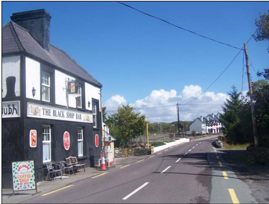
Fíor 2: An radharc aniar ar an Siopa Dubh fan N70

Tá stráice beag conláistí idir an droichead agus an N70, in aice le habhainn An Stéig. Tá deis anso stráicí eile dá leithéid a lonnú in aice na habhann is ar na bruacha. Bheadh droichead coisithe an-oiriúnach chun ceangal a bhunú idir dhá bhrúach na habhann is ar son sábháilteachta do choisithe ag dul tríd an mbaile. Agus droichid nó slite siúlóide á dtógáil caithfear cuimhneamh nach féidir gnéithe bradacha/ón dtaobh amuigh a thabhairt isteach ná a leathnú agus nach féidir cur le haon bhaol tuilte sa cheantar.