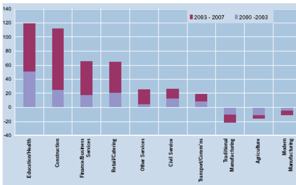
Foinse Fás na bPost in Éirinn, (000) 2000-2007